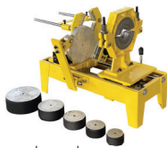
เครื่องเชื่อมท่อ