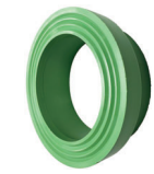
สตั๊บนเอ็น