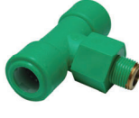
สามทางเกลียวนอก