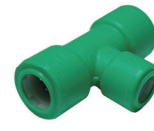
สามทางลด