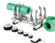
เครื่องเชื่อมท่อ