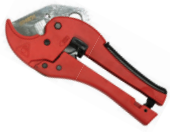
กรรไกรตัดท่อ