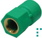
ข้อต่อตรงเกลียวใน