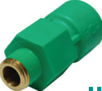
ข้อต่อตรงเกลียวนอก