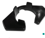
เครื่องมือถอดท่อ