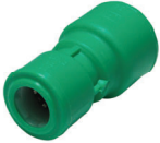
ข้อต่อตรงลด