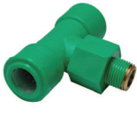
สามทางเกลียวนอก