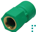
ข้อต่อตรงเกลียวใน