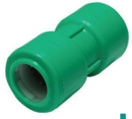
ข้อต่อตรง