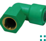
ข้องอเกลียวใน 90°