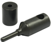
หัวเชื่อมแท่งซ่อม