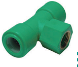
สามทางเกลียวใน