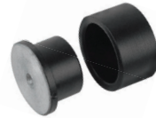
หัวเชื่อม