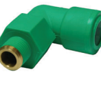
ข้องอเกลียวนอก 90°