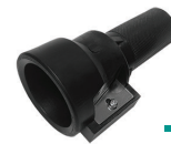
เครื่องมือปาดปลายท่อ