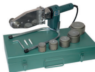
เครื่องเชื่อมท่อ