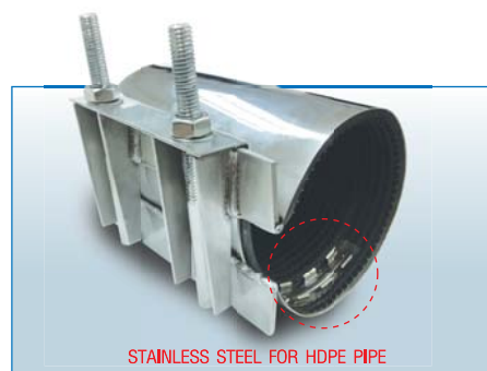
STAINLESS STEEL FOR HDPE PIPE