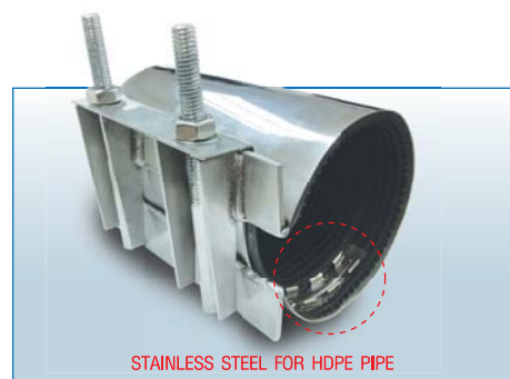
STAINLESS STEEL FOR HDPE PIPE