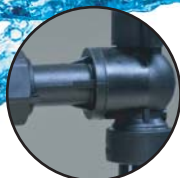
เชื่อมประกอบด้วยระบบอลูมิเนียม แข็งแรงทนทานกว่าการเชื่อมด้วยกา