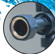
เกลียวทองเหลืองสั้น... ติดตั้งง่าย เชื่อมยึดติดแน่นกับบอลวาล์วพลาสติก