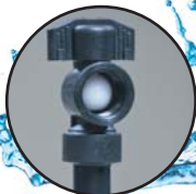
บอลวาล์วพลาสติก ABS ทนทาน คราบตะกรันไม่เกาะติด