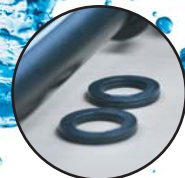
ซีลยางหนาถึง 3.6 มม. ป้องกันการรั่วซึม

“ นำเสนอสินค้าและบริการที่ลูกค้าพึงพอใจ ”